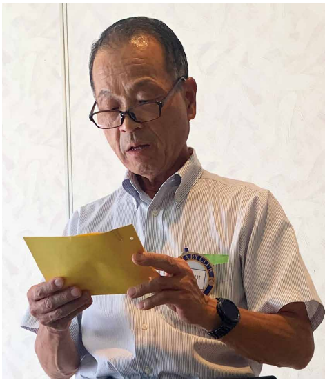
米山記念奨学会委員会報告