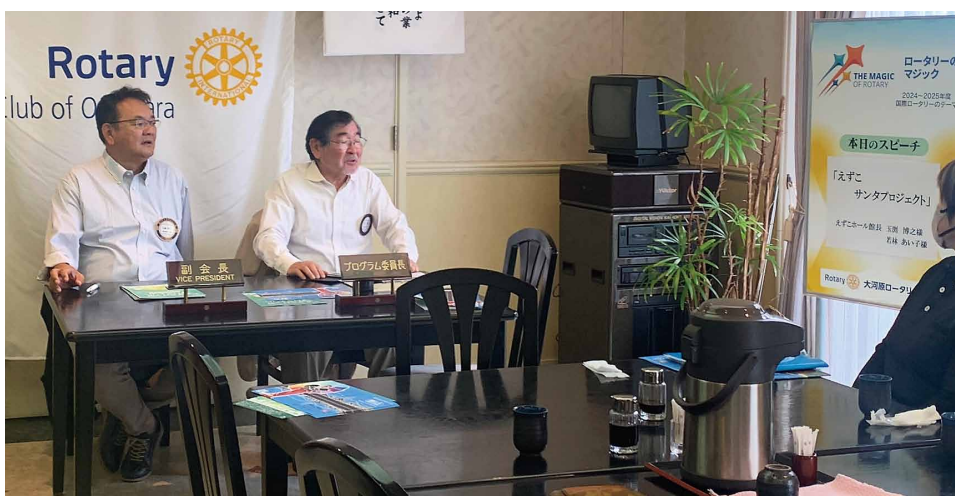
本日のプログラム