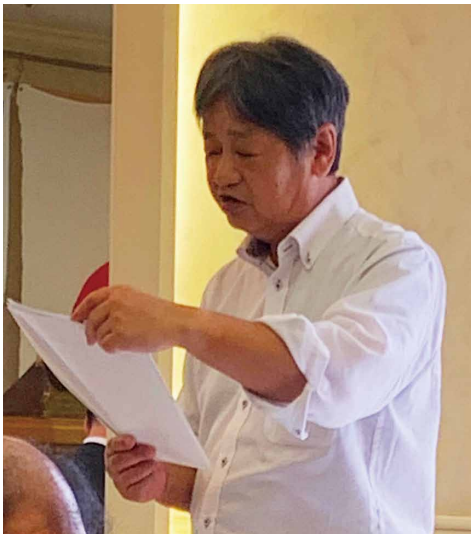
社会奉仕委員会連絡