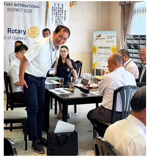
ゲストスピーカー紹介