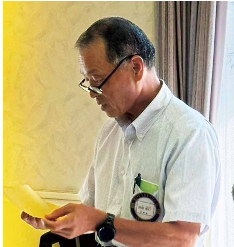
米山記念奨学会委員会報告