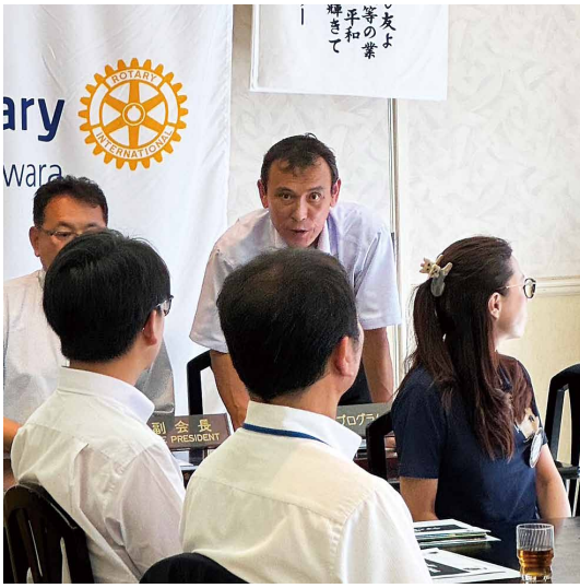
本日のプログラム紹介