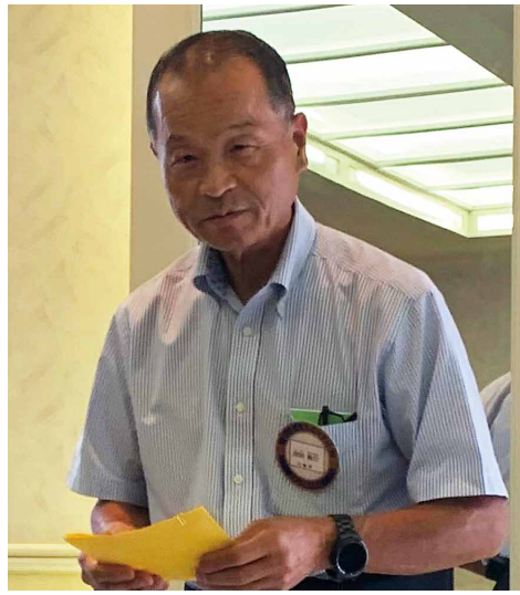
米山記念奨学会委員会報告