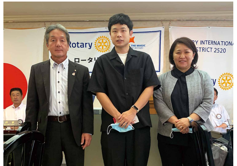
スピーカー記念写真