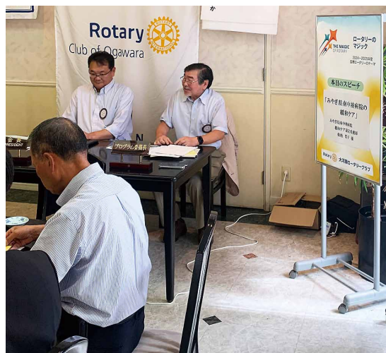
本日のプログラム発表