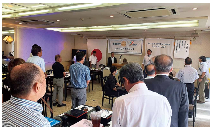
ロータリーソング斉唱