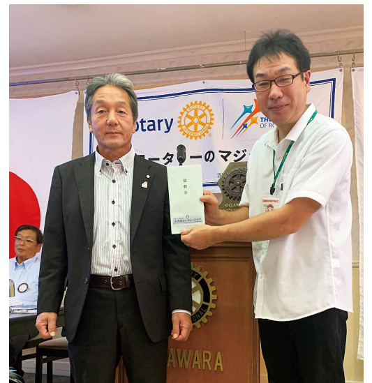
ゲストスピーチ御礼