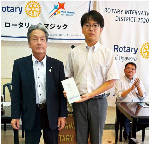
米山記念奨学金授与